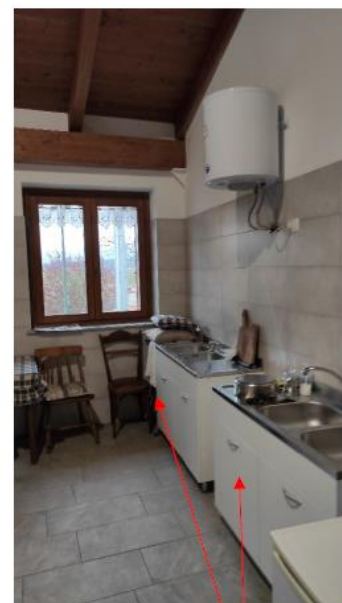
Chiudere l'interruttore generale dell'acqua se necessario o se ciò non comporta rischi, chiudere i rubinetti parziali ubicati negli armadi indicati sotto i rubinetti di ogni lavandino