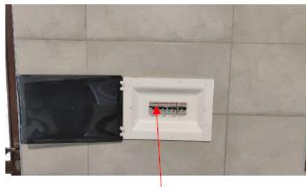
Sganciare l'interruttore generale presente all'interno del quadro elettrico dei locali